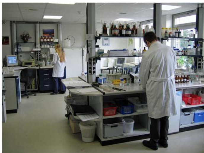
Wartig-Labor Nasschemische Analytik