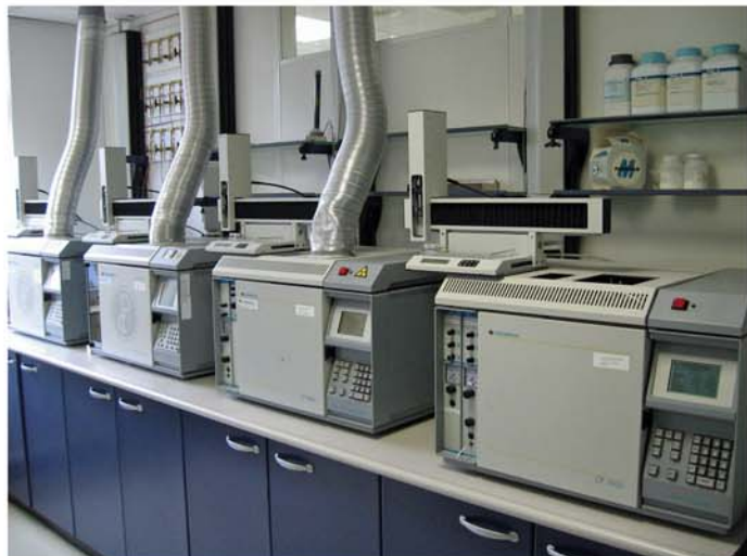
Gaschromatographen • Analyse von organischen Verbindungen wie PCB, MKW, Holzschutzmittel, Nitroaromaten (Sprengstoffanalytik)