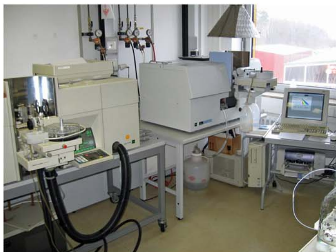
Flammen/Graphitrohr-AAS zur Metallanalytik